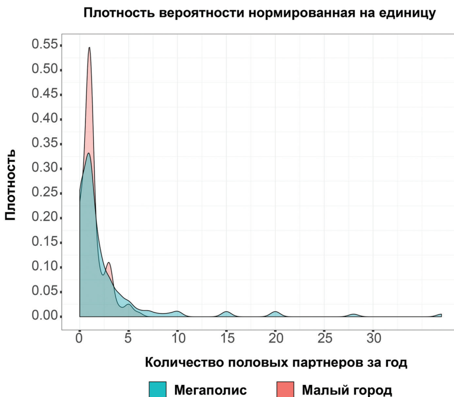
Рисунок 1. Диаграмма распределения плотности вероятности числа половых партнеров для мужской выборки в мегаполисе и небольшом городе (до 1,3 миллиона жителей и более)

Figure 1. The probability density function. A diagram for a male sample in a metropolis and a small city (up to 1.3 million inhabitants or more)